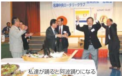
私達が踊ると阿波踊りになる