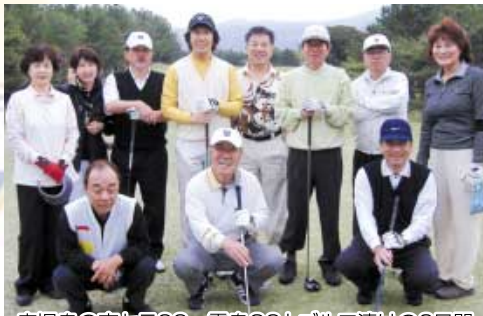
鹿児島の京セラCC～霧島GCとゴルフ漬けの2日間

又、将来両クラブの友好活動の中に、奄美の子供達に手を貸す様な、共同社会奉仕事業が実現できたらいいなと思ながらの3日間でした。