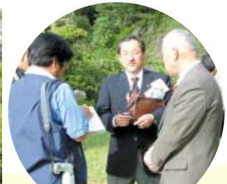
地元新聞社より取材を受ける。