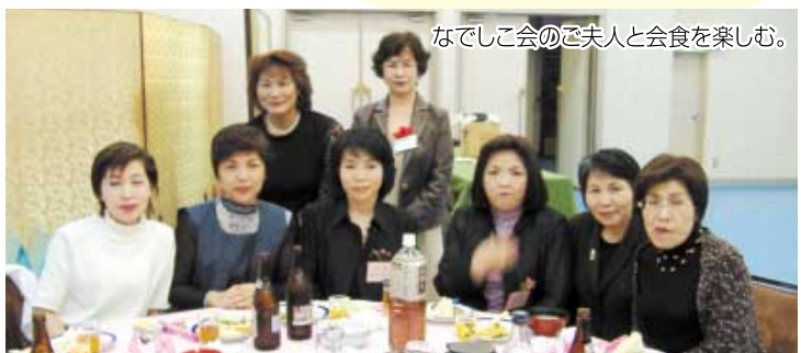
なでして会のご夫人と会食を楽しむ。